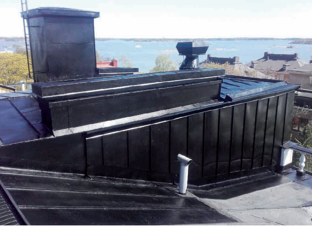
▲ Enkonol-paksupinnoite antaa lisää elinkaarta satavuotiaalle peltikatonle.